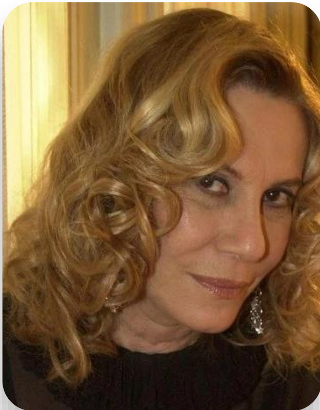
Nazaré (Senhora do Destino)

Carminha redefiniu o arquétipo da vilã: manipuladora, cômica e trágica ao mesmo tempo. Adriana Esteves entregou uma das atuações mais marcantes da teledramaturgia recente, tornando a personagem uma referência popular que atravessou gerações.