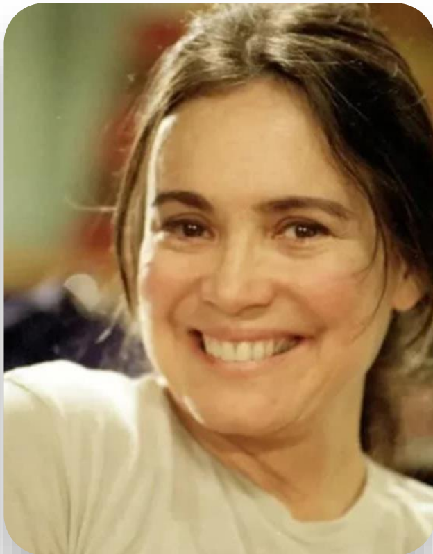
Helena (Por Amor)

Bebel é a “mulher da vida” com alma romântica. Camila Pitanga trouxe humanidade, humor e emoção à personagem, que conquistou o público e ampliou debates sobre moralidade, afeto e preconceito.