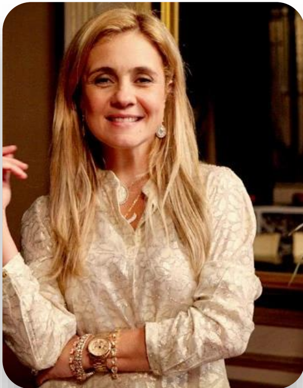
Carminha (Avenida Brasil)

A “Helena” de Manoel Carlos virou arquétipo da mulher sensível e contraditória. Em Por Amor, a troca dos bebês para poupar o sofrimento da filha colocou em cena dilemas éticos e emocionais que ainda mobilizam o público.