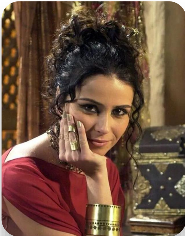
Jade (O Clone)

Símbolo de uma geração, Jade uniu tradição e modernidade ao viver o conflito entre amor e fé na cultura muçulmana. A força da personagem, seu figurino e a dança do ventre transformaram Giovanna Antonelli em um ícone cultural do início dos anos 2000.